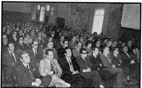
Este aspecto presentaba el salón de actos de la Casa de la Cultura en el acto de constitución del Colegio Oficial de Graduados Sociales.