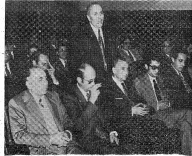
UNA DE LAS INTERVENCIONES.

nómica que la región está adquiriendo hará necesario en un plazo más o menos largo un gran número de graduados sociales, que el presidente del Colegio recién constituido cifra en unos 500.