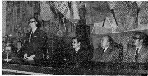
EL GOBERNADOR ACCIDENTAL PRONUNCIÓ UNAS PALABRAS.